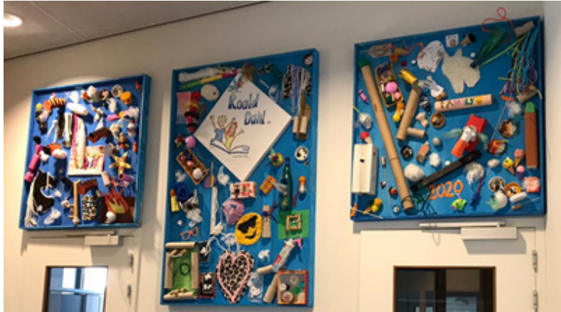
Het kunstwerk van groep 7 hangt op de bovenverdieping.